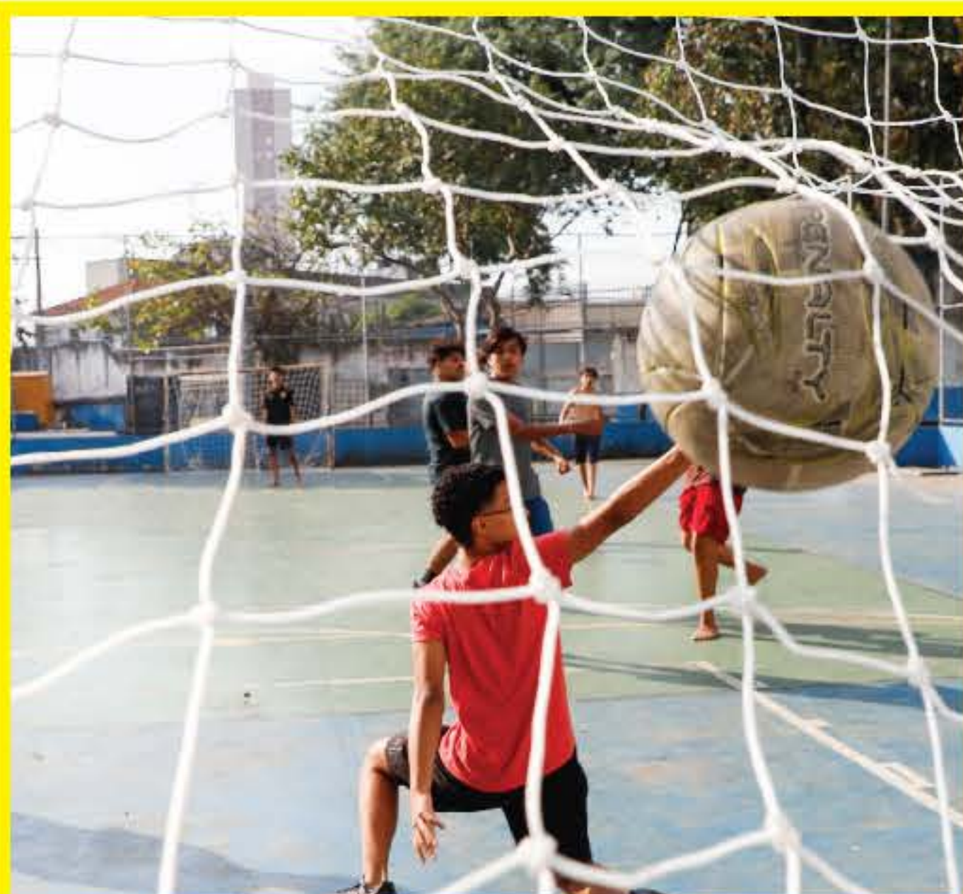
FUTEBOL DE QUADRA